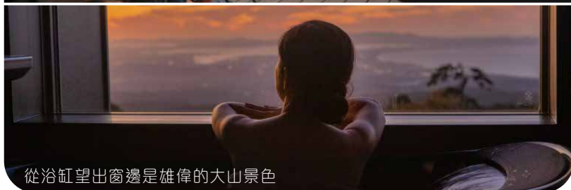
從浴缸望出窗邊是雄偉的大山景色