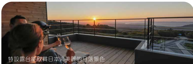
特設露台能欣賞日本海美麗的日落景色