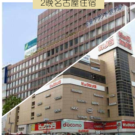
Meitetsu Grand / Meitetsu New Grand (2選1)